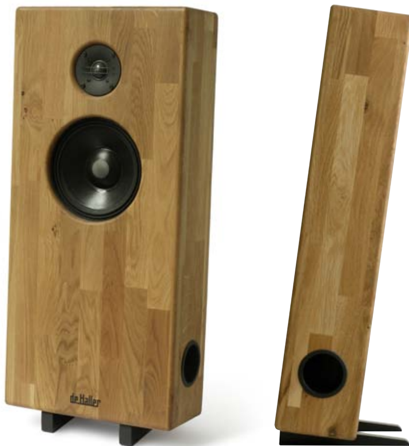
DINA 8 & DINA 8W Enceintes HI-FI haut de gamme Traditionnelles et Bluetooth®